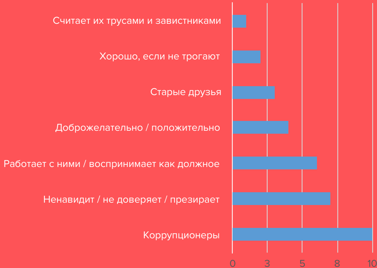
Что Персонаж-бизнесмен думает о чиновниках?